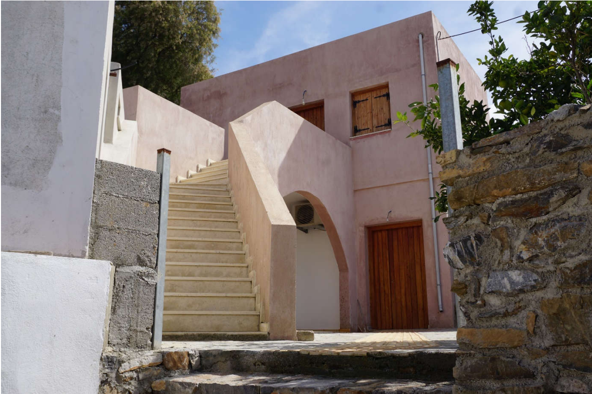
The new community center of the village, financed by EU program HEADER +