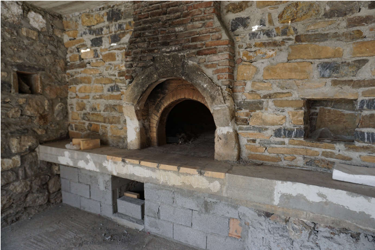
A new common stove for the village for bread and more